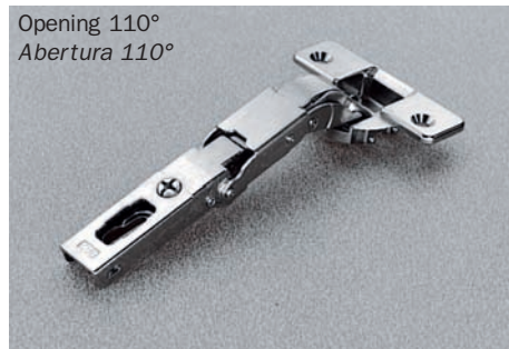
Opening 110° Abertura 110°